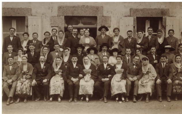
Photo: Après la guerre 14-18 on assiste à des mariages collectifs ; il faut rattraper le temps perdu !