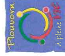
TABLEAU DU CONSEIL MUNICIPAL

EPCI à fiscalité propre : COMMUNAUTE DE COMMUNES DU PAYS DE LANDIVISIAU