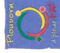
TABLEAU DU CONSEIL MUNICIPAL

EPCI à fiscalité propre : COMMUNAUTE DE COMMUNES DU PAYS DE LANDIVISIAU