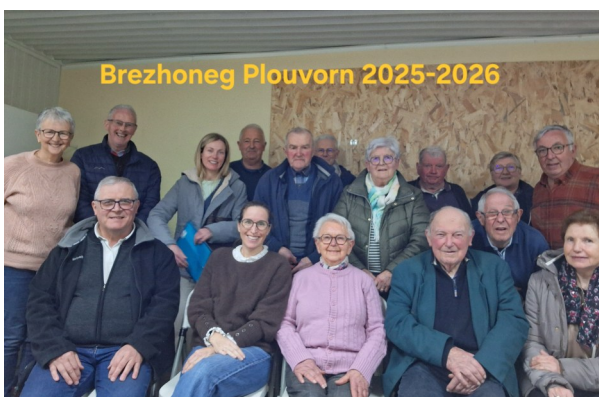
« Ar Vrezhonegerien Plouvorn, bloavezh 2025-2026 ».

Ce fut l'occasion aussi de tirer « la photo de classe » 2025-2026 avant de se donner rendez-vous pour la reprise des rencontres bimensuelles en septembre prochain.